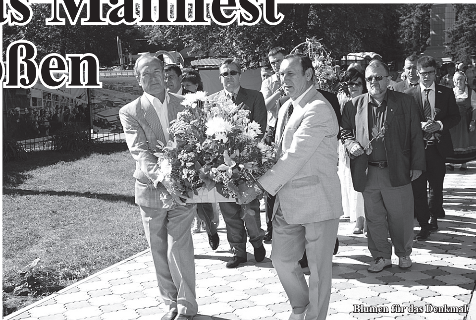
Blumen für das Denkmal