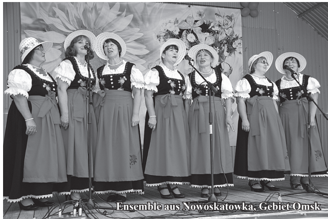
Ensemble aus Nowoskatowka, Gebiet Omsk

Anschließend besuchte man auch das Archiv der Wolgadeutschen, dessen 90-jähriges Bestehen gefeiert wurde. Der Festakt zum Jubiläum fand in der Aula der Mittelschule Nr. 33 statt. Hier