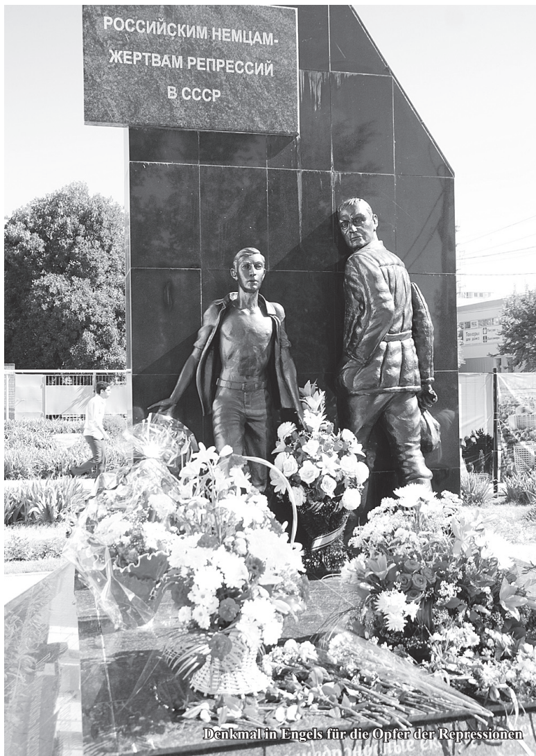
Denkmal in Engels für die Opfer der Repressionen

bolischen Freundschaftskranz, in dem „die Fäden der Freundschaft und Völkerverständigung“ eng ineinander verflochten waren.