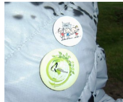
Сувениры НМО на память.

Уютная гостиная музея им. К. Белова распахнула для нас двери.